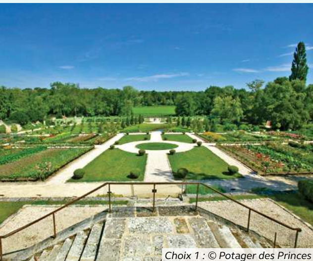
Choix 1 : © Potager des Princes

Une conférencière et une dentellière vous proposent de découvrir tout l'univers de la dentelle, des différentes techniques, au processus de production, en passant par les personnages clés, les spécificités de la Chantilly et autres anecdotes sur l'art du costume féminin au XIX e siècle.