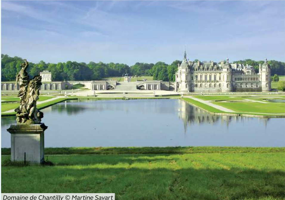
Domaine de Chantilly