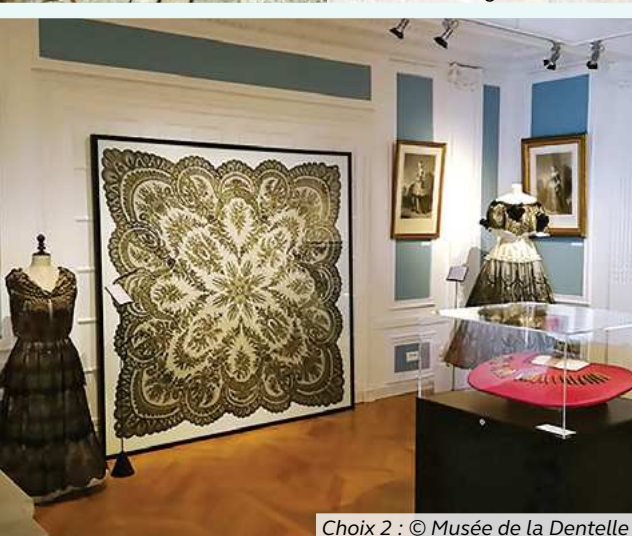
Choix 2 : © Musée de la Dentelle