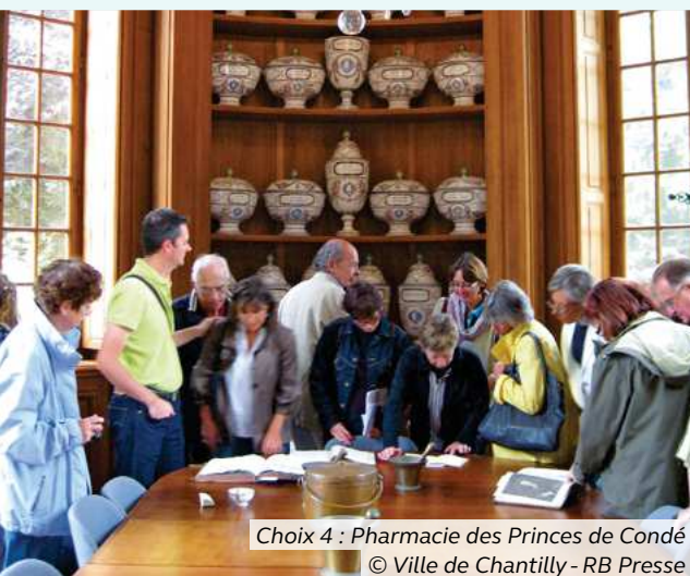
Choix 4 : Pharmacie des Princes de Condé

Ce bâtiment classé Monument Historique, ancien moulin des princes de Condé, est le cœur du système hydraulique qui servait à acheminer l'eau vers les fontaines et les jets d'eau des jardins dessinés par André Le Nôtre. Vivez l'évolution du mécanisme sur 3 siècles en activant une impressionnante roue en bois du XVII e puis en plongeant dans la révolution industrielle au son de la machinerie du XIX e . Comble du modernisme, le Pavillon abrite aussi la blanchisserie du duc d'Aumale, entièrement mécanisée, c'est une vraie curiosité qui resta en activité jusqu'aux années 1970. Vous vous émerveillerez par la technique d'antan.