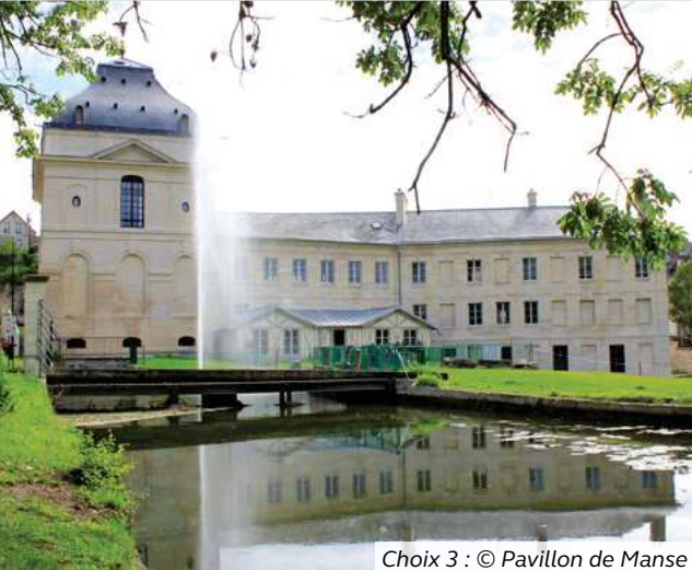
Choix 3 : © Pavillon de Manse